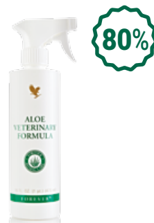
Aloe Veterinary Formula Алое ветеринарна формула