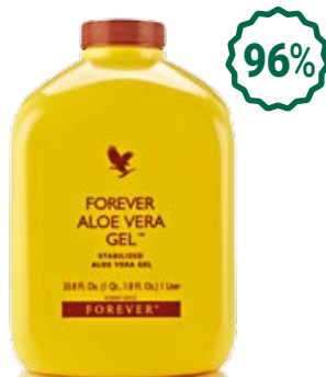
Forever Aloe Vera Gel Гел от алое вера

Много от продуктите на Форевър съдържат алое вера, но в някои процентът е по-висок и затова са особено конкурентоспособни в бранша. Това са и продуктите, върху които ви предлагаме да акцентирате, когато разказвате на клиентите си за полезните свойства на алоето.