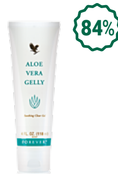
Aloe Vera Gelly Алое вера гел