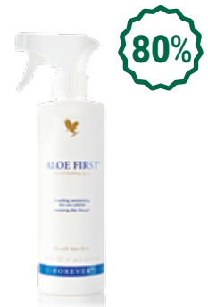
Aloe First Алое фърст