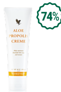
Aloe Propolis Creme Алое прополис крем