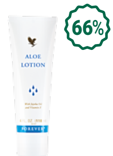
Aloe Lotion Алое Lotion